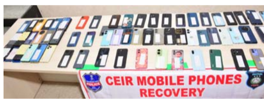
అధారం గురించి సమాచారం కాజేస్తుందన్నారు. ఇది వ్యక్తిగత, సామాజిక భద్రతకు భంగం కలుగుతుందన్నారు. దొంగిలించిన ఫోన్లను నేరాలకు పాల్పడే అవకాశం ఉన్నందున ప్రతి ఒక్కరూ సిఈఐఆర్ వెబ్సైట్లో వివరాలు నమోదు చేసుకోవాలన్నారు. అదే విధంగా ఎవరైనా సెకండ్ హ్యాండ్ ఫోన్ లు కొనే ముందు అప్లికేషన్లో అట్టి ఫోన్ యొక్క వివరాలను అనగా బయంకాబ నంబర్ ను నమోదు చేసి చెక్ చేసుకోవాలని తద్వారా అట్టి ఫోన్ ఆ ఫోన్ యొక్క స్టేట్స్ తెలుస్తుంది అన్నారు. అదేవిధంగా ఎవరైనా సెల్ ఫోన్లను దొరికితే సంబంధిత పోలీస్ స్టేషన్ గాని లేదా ఆ నెంబర్ వారికి ఫోన్ చేసి వారికి అప్పగించాలిగా సూచించారు. ఈ సందర్భంగా సాంకేతికతను ఉపయోగించి మొబైల్ ఫోన్ల రికవరీ చేయడంలో ప్రతిభ కనబరిచిన బడి కోర్ ఇన్స్పెక్టర్ సిఈఐఆర్ టీం ను జిల్లా ఎస్పీ అభినందించి రివార్డ్ అందజేశారు.