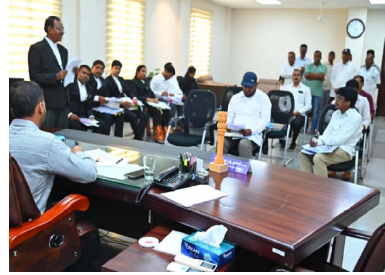
సవగీతం, మే 23, (జగిత్యాల ప్రతినిధి):