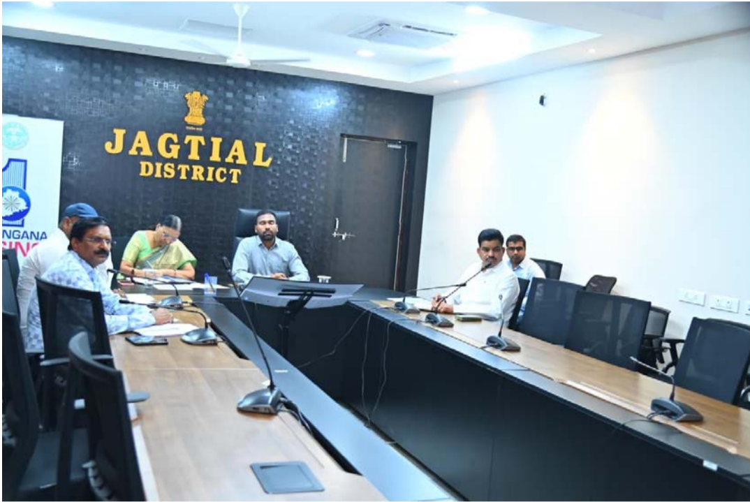
అధికారులకు ఆదేశించారు. సోమవారం రోజున జిల్లా వీడియో కాన్ఫరెన్స్లో ఆడియోలు, కలెక్టరేట్ ఏవో, ఇతర కలెక్టరేట్లో సంబంధిత శాఖ అధికారులతో సమావేశం నిర్వహించి తదుపరి చర్చలపై చర్చించనున్నట్లు తెలిపారు. ఈ