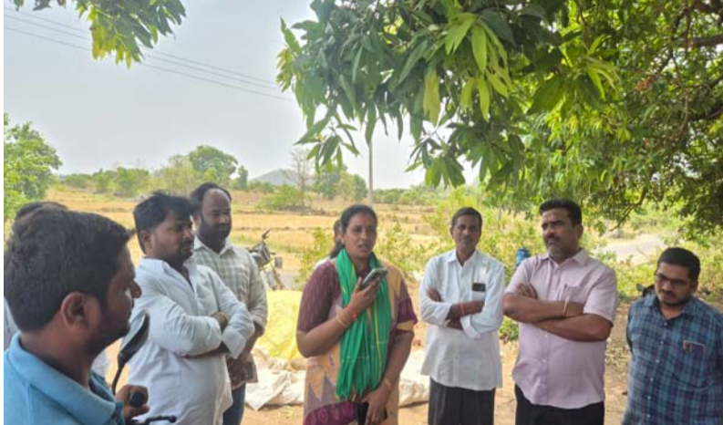
ఘనత మాజీ ముఖ్యమంత్రి కేసీఆర్ దేసని, తెలంగాణను దేశానికి అనుసారంగా తీర్చిదిద్దండి అయిన పాలనేనని పేర్కొన్నారు. ప్రస్తుతం రైతుల పరిస్థితి అత్యంత దయనీయంగా ఉందని, ఒకవైపు ఎండలు, మరోవైపు కల్లాల్లో పేరుకుపోయిన వడ్లతో రైతులు తీవ్ర ఆందోళనలో ఉన్నారని చెప్పారు. త్వరలో వర్షాలు వచ్చే అవకాశం ఉండటంతో రైతులు భయాందోళనకు గురవుతున్నారని తెలిపారు. రైతును రాజు చేస్తానని చెప్పిన ముఖ్యమంత్రి రేవంత్ రెడ్డి రైతులను మోసం చేశారని ఆరోపించారు. రైతులందరూ పూర్తిగా అమలు కాకపోగా, చేతికొచ్చిన పంటను కొనుగోలు చేయాలని రైతులు వేడుకోవాల్సిన పరిస్థితి ఏర్పడిందన్నారు. ప్రభుత్వం పత్రికా ప్రకటనలతో పరిమితమైందని, క్షేత్రస్థాయిలో కొనుగోళ్లు సక్రమంగా జరగడం లేదని విమర్శించారు. బీఆర్ఎస్ హయాంలో ప్రణాళికా బద్ధంగా రైతులకు ఎలాంటి ఇబ్బందులు లేకుండా ధాన్యం