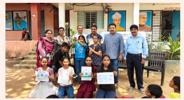
సవగీతం, మే 23, (జగిత్యాల ప్రతినిధి)

ప్లాస్టిక్ ను నిషేధించి పర్యావరణాన్ని కాపాడుదాం