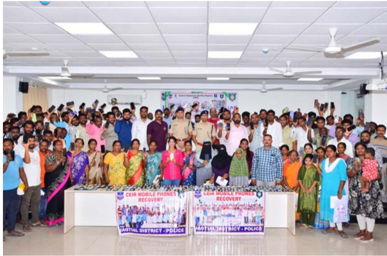
సైబర్ మోసాలపై ప్రజలు అప్రమత్తంగా ఉండాలి

సెల్ ఫోన్ పోయిన, చోరికి గురైన ఆందోళన చెందవద్దని సిఈఐఆర్ ద్వారా తిరిగి పొందవచ్చని జిల్లా ఎస్పీ అన్నారు. జిల్లా పోలీస్ ప్రధాన కార్యాలయంలో ఏర్పాటు చేసిన కార్యక్రమం లో పోగొట్టుకున్న చోరి గురైన 117 మొబైల్ ఫోన్లను ( సుమారు 23 లక్షల విలువగల ) స్వాధీనం చేసుకొని బాధితులకు అప్పగించారు. ఈ సందర్భంగా ఎస్పీ మాట్లాడుతూ.. పోయిన లేదా చోరికి గురైన మొబైల్ ఫోన్లను త్వరితగతిన పట్టుకోవడానికి సిఈఐఆర్ వెబ్సైట్ ఎంతో ఉపయోగపడుతుందని తెలిపారు. సిఈఐఆర్ వెబ్సైట్లో ఉపయోగదారులు వివరాలను నమోదు చేసుకుంటే మొబైల్స్ ని ఈ పోర్టల్ ద్వారా సులభంగా స్వాధీనం చేసుకునే అవకాశం ఉంటుందని తెలిపారు. పోయిన సెల్ ఫోన్ రికవరీ కోసం ఇన్స్ట్రక్షన్ స్థాయి అధికారి ఆధ్వర్యంలో ఒక ఆర్ ఎస్ ఐ, హెడ్ కానిస్టేబుల్, ఇద్దరు కానిస్టేబుల్ లతో ప్రత్యేక టీం ఏర్పాటు చేయడం జరిగిందని అన్నారు. సిఈఐఆర్ పోర్టల్ ప్రారంభమైన నాటి నుండి ఇప్పటి వరకు జిల్లా వ్యాప్తంగా 1838 ( 3,67,60,000 లక్షల విలువగల ) ఫోన్ లను రికవరీ చేసి బాధితులకు అందించడం జరిగిందని అన్నారు. పోయిన సెల్ ఫోన్ పట్ల అక్రమ చేస్తే ఫోన్లలో ఉన్న వ్యక్తిగత