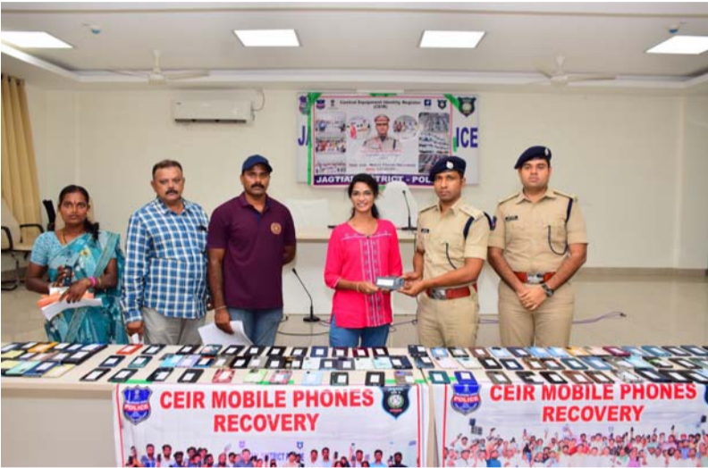
సవగీతం, మే 23, (జగిత్యాల ప్రతినిధి)