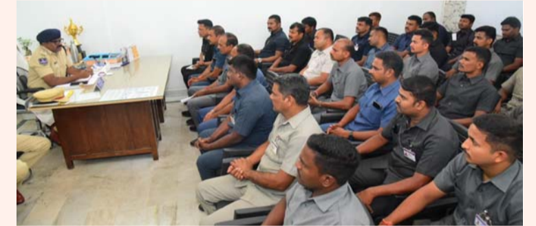
సవగీతం, మే 23, (కరీంనగర్ ప్రతినిధి)

కరీంనగర్ కమిషనరేట్ లో ఏఆర్ సిబ్బందితో ప్రత్యేక సమీక్షా సమావేశం చిన్న పాఠశాలకు కూడా తావుండొచ్చు: సిబ్బందికి ఏసీపీ ఆదేశం