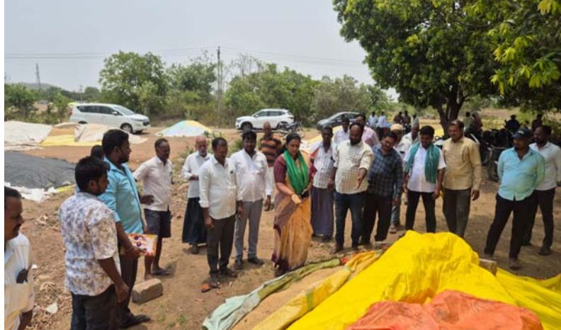
సవగీతం, మే 23, (రాయకల్ ప్రతినిధి):