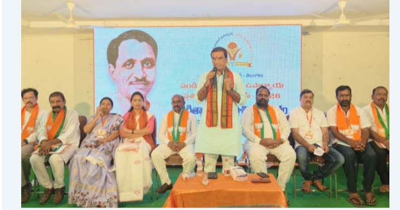
సవగీతం, మే 23, (జగిత్యాల ప్రతినిధి) :