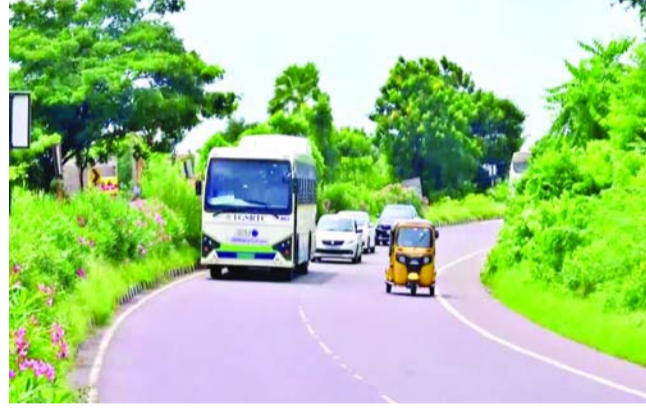
మొత్తం 441 రహదారులను 34 ప్యాకేజీల్లో అభివృద్ధి చేయనున్నారు. సుమారు రూ.13,006.27 కోట్ల వ్యయంతో 6,092.37 కిలోమీటర్ల మేర రహదారుల నిర్మాణం చేపట్టేందుకు రాష్ట్ర ప్రభుత్వం ఆమోదం తెలిపింది. రాష్ట్రవ్యాప్తంగా రహదారి నెట్ వర్క్ ను మెరుగుపరచడంలో ఇది కీలక ముందడుగుగా - మగతా3లో