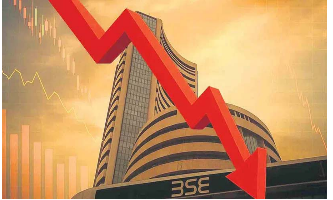
రూపాయి మారక విలువ 95.05గా ఉంది. అంతర్జాతీయ ఉంది. బంగారం ఔస్స్ ధర 4530 డాలర్ల వద్ద మార్కెట్లో బ్యారెల్ క్రూడాయిల ధర 91.40 డాలర్లుగా కొనసాగుతోంది.

భారతీయ స్టాక్ మార్కెట్లు శుక్రవారం భారీగా పతనమయ్యాయి. ఉదయం స్వల్ప లాభాల్లో ప్రారంభమైన ట్రేడింగ్ చివరికి అమ్మకాల ఒత్తిడి కారణంగా భారీనష్టాల్లో ముగిసింది. బీఎస్ఈ సెన్సెక్స్ 1,092.06 పాయింట్లు (1.44 శాతం) నష్టపోయి 74,775.74 వద్ద ముగిసింది. సెన్సెక్స్ ఇండ్రాండేలో 76,220.02 పాయింట్లు గరిష్టాన్ని తాకినప్పటికీ చివరికి నష్టాల్లో ముగిసింది. ఎన్ఎస్ఈ నిఫ్టీ కూడా 359.40 పాయింట్లు (1.50 శాతం) నష్టపోయి 23,547.75 వద్ద ముగిసింది. దేశంలో ఇన్వెస్టర్ల సంపద ఈ ఒక్కరోజే దాదాపు రూ.5 లక్షల కోట్లు నష్టపోయింది. ప్రస్తుతం మార్కెట్ విలువ రూ.466 లక్షల కోట్లుగా ఉంది. దేశంలో రుతుపవనాల రాక ఆలస్యం కానుందనే వార్తలు, అమెరికా-ఇరాన్ మధ్య శాంతి చర్చలు కొలిక్కి రాకపోవడం మార్కెట్ పతనానికి ప్రధాన కారణాలు. దేశంలో రుతుపవనాలు ఆలస్యమైతే వర్షాలు సరిగ్గా కురవవు. దీనివల్ల వ్యవసాయ రంగం తీవ్ర సంక్షోభాన్ని ఎదుర్కోవాల్సి వస్తుందనే భయం మార్కెట్ను దెబ్బతీసింది. సెన్సెక్స్ 30 సూచీలో ఇన్ఫోసిస్, ఎల్అండ్టీ, టెక్ మహేంద్రా, హెచ్ఎస్ఎల్ టెక్నాలజీస్ షేర్ లాభాలు చవిచూడగా, మిగతా షేర్లు భారీగా నష్టపోయాయి. వాటిలో మహేంద్రా అండ్ మహేంద్రా, టాటా స్టీల్, పవర్ గ్రిడ్ కార్పొరేషన్ షేర్ల ఎక్కువగా నష్టాలు చవిచూశాయి. మరోవైపు డాలర్తో