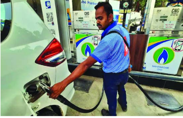
ప్రత్యామ్నాయంగానే కొనసాగుతోంది. ఇదే సమయంలో పెట్రోల్, డీజిల్ ధరలు కూడా పెరుగుతున్నాయి. ప్రస్తుతం ముంబైలో లీటర్ పెట్రోల్ ధర రూ.111.21గా, డీజిల్ ధర రూ.97.83గా నమోదైంది. దీంతో రవాణా రంగంపై ఇంధన వ్యయాల భారం మరింత పెరిగే అవకాశం కనిపిస్తోంది.

ప్రయోజనాలు అందించే మార్గాలను అన్వేషిస్తున్నట్లు సంస్థ తెలిపింది. ఇటీవలి కాలంలో సీఎన్జీ ధరలు పెరగడం ఇది రెండోసారి. గత మే 14న కూడా ఎంజీఎల్ కిలోకు రూ.2 చొప్పున ధరలను పెంచింది. తాజా పెంపుతో ఆటోరిక్షాలు, ట్యాక్సీలు, బస్సులు సహా సీఎన్జీ ఆధారిత రవాణా సేవల నిర్వహణ వ్యయాలు మరింత పెరగనున్నాయి. ముంబై, ఛానై, నవీ ముంబైలో పాటు ఎంఎంఆర్లోని ఇతర ప్రాంతాల్లో ఈ ధరల పెంపు అమలులోకి వచ్చింది. ఎంజీఎల్ గ్యాస్ సరఫరా నెట్వర్క్ కళ్యాట్, రాయ్గడ్, రత్నగిరి, లాతూర్, ఉస్మానాబాద్, చిత్రదుర్గ, దావణగెరె వంటి ప్రాంతాలకు కూడా విస్తరించి ఉంది. పెట్రోల్, డీజిల్తో పోలిస్తే ఇంకా చాక్ ధరలు పెరిగినా కిలోమీటరుకు అయ్యే నిర్వహణ వ్యయ పరంగా సీఎన్జీ ఇబ్బందికి పెట్రోల్, డీజిల్తో పోలిస్తే చాక్సెన