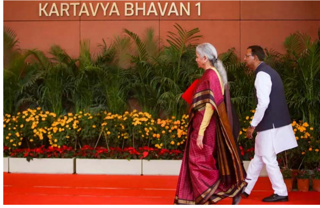
పుంజీకోవడం లేదు. పశ్చిమాసియా సంక్షోభం వల్ల తదితర సవాళ్లు వీటికి తోడయ్యాయి. ఈ నేపథ్యంలోనే ఆర్థిక రూపాయి బలహీనపడటం, క్రూడాయిల్ రేట్లు పెరగడం శాఖ కసరత్తు ప్రాధాన్యం సంతరించుకుంది.

న్యూఢిల్లీ: ఆర్థిక విధానాలు.. బడ్జెట్ ప్రతిపాదనల రూపకల్పనకు, పశ్చిమాసియా సంక్షోభంపరమైన సవాళ్లను ఎదుర్కొనేందుకు తీసుకోవలసిన చర్యల గురించి క్షేత్రస్థాయిలో సమాచారాన్ని సేకరించేందుకు కేంద్ర ప్రభుత్వం సిద్ధమైంది. ఇందుకోసం దేశవ్యాప్తంగా ఫ్యాక్టరీలు, పరిశ్రమ క్లస్టర్లను సందర్శించడంపై కేంద్ర ఆర్థిక శాఖలో భాగమైన ఆర్థిక వ్యవహారాల విభాగం కసరత్తు ప్రారంభించినట్లు తెలుస్తోంది. దీని ప్రకారం ఆర్థిక శాఖలోని అదనపు కార్యదర్శి, సంయుక్త కార్యదర్శి లేదా రైడెక్టర్ సారథ్యంలో అయిదుగురు వరకు సభ్యులతో బృందాలు ఏర్పాటు చేస్తారు. ఈ బృందాలు భారీ, మధ్య, చిన్న తరహా తయారీ యూనిట్లను సందర్శిస్తాయి. వివిధ రంగాల వ్యాప్తంగా విధానాలు, నిర్వహణపరమైన సవాళ్లను పరిశీలిస్తాయి. మౌలిక సదుపాయాలు, రెగ్యులేటరీ అవరోధాలు, సరఫరా వ్యవస్థలో అవాంతరాలు, నిధుల లభ్యతపరమైన సవాళ్లు, నైపుణ్యంలో కొరత, సాంకేతికత వినియోగం మొదలైన అంశాలు వ్యాపారాలపై చూపుతున్న ప్రభావాల గురించి నేరుగా తెలుసుకుంటాయి. ఒక్కో విడతలో కనీసం రెండు సార్లు కార్యదర్శి, సీఎంఐ, ఇన్ఫ్రా, పరిశోధనలు తదితర రంగాల సంస్థలను సందర్శించి, పరిస్థితుల గురించి బృంద సభ్యులు తెలుసుకుంటారు. కొన్ని రంగాలపై ప్రభుత్వం గణనీయంగా వ్యయం చేస్తున్నప్పటికీ, వివిధ కారణాలవల్ల ప్రైవేట్ పెట్టుబడులు ఇంకా