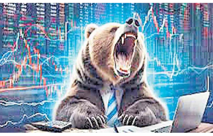
రంగ షేర్లు లాభాల్లో ముగిశాయి. గత నాలుగు రోజుల్లో సెన్సెక్స్ 2,221.62 పాయింట్లు లేదా 2.90 శాతం నష్టపోగా, నిష్ఠి 649.1 పాయింట్లు లేదా 2.70 శాతం కోల్పోయింది.

జియోజిట్ పై నాన్లయర్ హెడ్ విసోడ్ నాయర్ తెలిపారు. 30 షేర్ ఇండెక్స్ సూచీలో హెచ్ఓఎఫ్ఐసీ, బిటీసీ, ఎన్టీపీసీ, మహేంద్రా అండ్ మహేంద్రా, కొటక్ మహేంద్రా బ్యాంక్, బజాజ్ ఫైనాన్స్ షేర్లు భారీగా నష్టపోయాయి. కానీ, టెక్ మహేంద్రా, ఇస్కోసిస్, డీసీఎస్, ఇంటర్గోల్ట్ ఏవియేషన్, హెచ్ఓఎల్ టెక్నాలజీ, టాటా స్టీల్ షేర్లు లాభాల్లో ముగిశాయి. బీఎస్ఐసీ మిడ్కాస్ట్, స్మార్ట్కాస్ట్ ఇండెక్స్లు నష్టపోయాయి. రంగాలవారీగా పవర్ సూచీ అత్యధికంగా 2.90 శాతం కోల్పోగా.. క్యాపిటల్ గ్రూడ్ 2.44 శాతం, యుటిలిటీస్ 2.12 శాతం, ఇండస్ట్రియల్స్ 2.11 శాతం, రియల్టీ 2.03 శాతం, ఎఫ్ఐఎస్ఐ 2.02 శాతం చొప్పున పతనం చెందాయి. కానీ, బిటీ, ఎన్సర్వీ, మెటల్