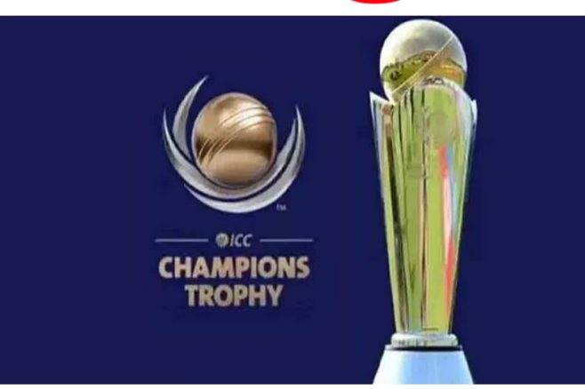
అధ్యక్షుడు జై షా నేతృత్వంలో సమావేశమైన ఐసీసీ సభ్యులు షెడ్యూల్ మార్చాలని, ఫిబ్రవరిలో 10 జట్లతో టోర్నీ జరపాలని తీర్మానించారు. దాంతో.. 2027 ఫిబ్రవరిలో ఐదు

అంతర్జాతీయ క్రికెట్ మండలి తొలిసారి నిర్వహించ తలపెట్టిన మహిళల ఛాంపియన్స్ ట్రోఫీ తేదీ మారింది. షెడ్యూల్ ప్రకారం వచ్చే ఏడాది జూన్లో టోర్నమెంట్ జరగాలి. కానీ, ఈ మెగా ఈవెంట్ ను అంతకంటే ముందుగానే ఆడించాలని ఐసీసీ తీర్మానించింది. 2027 ఫిబ్రవరిలో 10 జట్లతో ఛాంపియన్స్ ట్రోఫీ నిర్వహించాలని నిర్ణయించింది. ఐపీఎల్ 19వ సీజన్ ఫైనల్ అనంతరం అహ్మదాబాద్లో జరిగిన త్రైమాసిక సమావేశంలో ఐసీసీ షెడ్యూల్ షెడ్యూల్ మార్పును ఆమోదం తెలిపారు. వరల్డ్ కప్ వంటి ఐసీసీ ఈవెంట్లలో సమాన సగదు బహుమతితో మహిళా క్రికెట్ అభివృద్ధికి బాటలు వేసిన ఐసీసీ ఈసారి ఛాంపియన్స్ ట్రోఫీతో అతివల ఆటను మరో మెట్టు ఎక్కించాలనుకుంటోంది. అందులో భాగంగానే వచ్చే ఏడాది(2027) జూన్ -- జూలైలో టోర్నీ జరపాలని ఐసీసీ భావించింది. కానీ, ఫిబ్రవరిలో ఈ మెగా టోర్నీని నిర్వహించాలని నిర్ణయించింది. అహ్మదాబాద్లో ఆదివారం