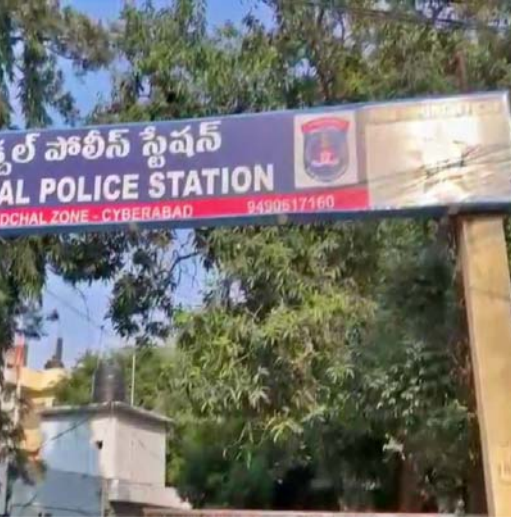
ఇవాళ ఉదయం కోర్టులో హాజరుపరిచినట్లు తెలిపారు. యువతి, యువకులు ఇద్దరూ మేజిస్ట్రేసని ఏసీబీ తెలిపారు.