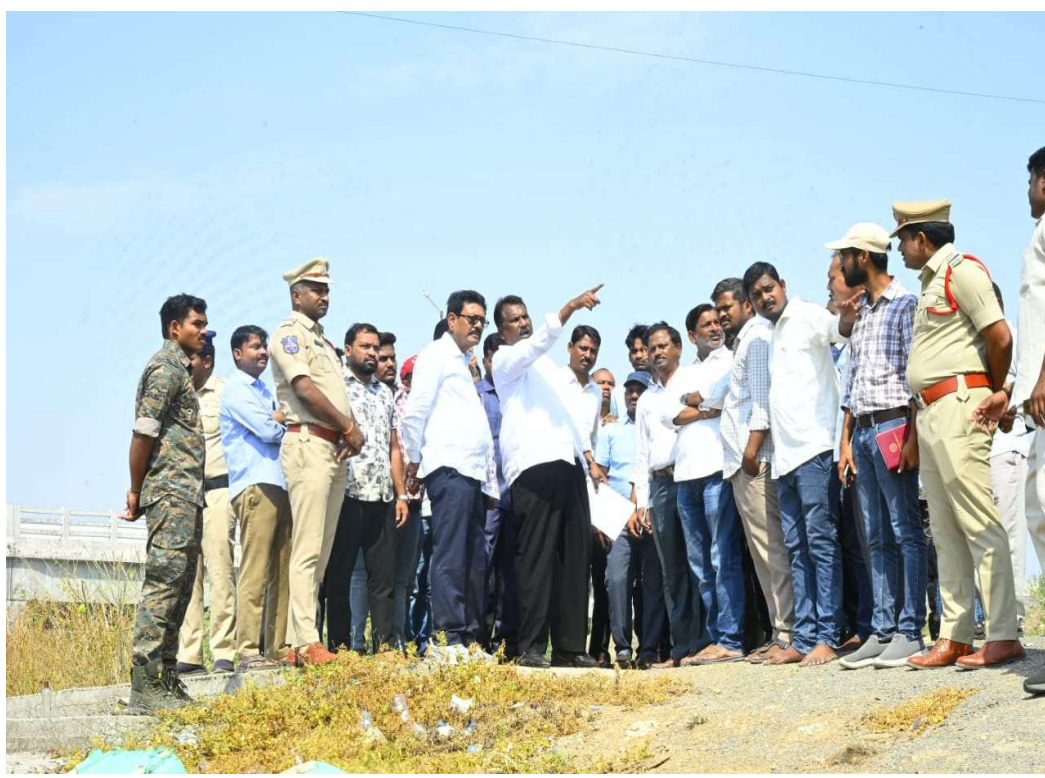
తెలిపారు. గత ప్రభుత్వ కాలంలో పుష్కరాల పనులు ఆలస్యంగా ప్రారంభించడం వల్ల భక్తులు ఇబ్బంది పడ్డారని మంత్రి అన్నారు. దేశంలోని వివిధ ప్రాంతాల నుండి వచ్చే భక్తులకు ఎలాంటి ఆసౌకర్యాల లేకుండా ఏడాది ముందుగానే పుష్కరాల పనులు ప్రారంభించి సకల సౌకర్యాల కల్పనకు కృషి చేస్తామని మంత్రి తెలిపారు.

సవగీతం,జూన్03,(జగిత్యాల ప్రతినిధి): నోరు ఉందని జనసేన అధినేత పవన్ కళ్యాణ్ ఇష్టం వచ్చినట్లు మాట్లాడాడు. రాష్ట్ర సాంఘిక సంక్షేమ శాఖ మంత్రి అడ్డూరి లక్ష్మణ్ కుమార్ హితవు పలికారు. బుధవారం జగిత్యాల జిల్లా వెల్లూరు మండలంలో రోడ్డు భవనాలు, పంచాయతీ రాజ్ శాఖ అధికారులతో పుష్కరాల పనులపై అధికారులతో చర్చించారు. ఈ సందర్భంగా మీడియా ప్రతినిధులు అడిగిన ప్రశ్నలకు సమాధానం ఇస్తూ జనసేన అధినేత పవన్ కళ్యాణ్ వ్యాఖ్యలపై మంత్రి స్పందించారు. తెలంగాణ మీ జాగీర అంటూ పవన్ చేసిన వ్యాఖ్యలను మంత్రి తీవ్రంగా ఖండించారు. నోరు ఉందని పవన్ కళ్యాణ్ ఇష్టం వచ్చినట్లు మాట్లాడితే బాగుందని హెచ్చరించారు. పవన్ కళ్యాణ్ సభకు అనుమతి పై ప్రభుత్వ నిబంధనల ప్రకారం సభ నిర్వహణకు అనుమతి ఇస్తారని మంత్రి తెలిపారు. పవన్ కళ్యాణ్ ను పీఠానికి అందరూ అభిమానిస్తారని మంత్రి అన్నారు. తెలంగాణ, ఆంధ్ర ప్రజలు అన్నదమ్ములు లాగా కలిసి ఉంటున్నారని మంత్రి అన్నారు. భారత దేశంలోనే తెలంగాణ ప్రజలకు ఉన్న మంచి మనసు ఎవరికీ ఉండదని మంత్రి తెలిపారు. తెలంగాణ ప్రజలు దయా గుణంతో ఉంటారని వచ్చే ఎన్నికల్లో జనసేన పార్టీ పోటీ చేసిన ముఖ్యమంత్రి రేవంత్ రెడ్డి నాయకత్వంలో మరో మారు రాష్ట్రంలో కాంగ్రెస్ పార్టీ అధికారంలోకి వస్తుందని మంత్రి