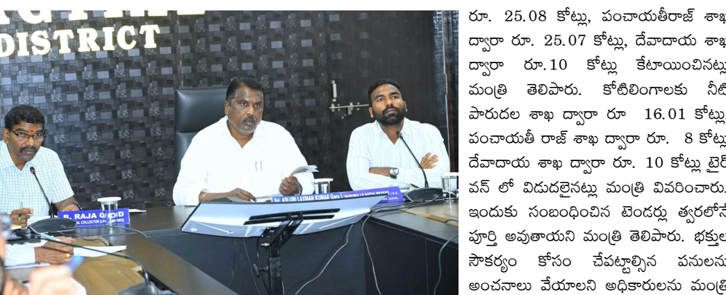
రూ. 25.08 కోట్లు, పంచాయతీరాజ్ శాఖ ద్వారా రూ. 25.07 కోట్లు, దేవదారు శాఖ ద్వారా రూ.10 కోట్లు కేటాయించినట్లు మంత్రి తెలిపారు. కోటింగాలకు నీటి పారుదల శాఖ ద్వారా రూ 16.01 కోట్లు, పంచాయతీ రాజ్ శాఖ ద్వారా రూ. 8 కోట్లు దేవదారు శాఖ ద్వారా రూ. 10 కోట్లు టైర్ పవన్ లో విడుదలైనట్లు మంత్రి వివరించారు. ఇందుకు సంబంధించిన టెండర్లు త్వరలోనే పూర్తి అవుతాయని మంత్రి తెలిపారు. భక్తుల సౌకర్యం కోసం చేపట్టాల్సిన పనులను అంపనాలు వేయాలని అధికారులను మంత్రి ఆదేశించారు. ఎందుకు సంబంధించిన నిధులు రాష్ట్ర ముఖ్యమంత్రి శ్రీ రేవంత్ రెడ్డి గారితో చర్చించి విడుదలయ్యే విధంగా చర్యలు తీసుకుంటామని మంత్రి తెలిపారు.

సవగీతం, జూన్03,(జగిత్యాల ప్రతినిధి): 2027 లో నిర్వహించే గోదావరి పుష్కరాలకు అవసరమైన నిధులు తీసుకువస్తానని భక్తులకు ఎక్కడ ఆసౌకర్యాల కలగకుండా ఏర్పాటు చేయాలని రాష్ట్ర సాంఘిక సంక్షేమ శాఖ మంత్రి అడ్డూరి లక్ష్మణ్ కుమార్ అధికారులను ఆదేశించారు. గోదావరి పుష్కరాలపై జగిత్యాల జిల్లా కలెక్టర్ కార్యాలయంలో జగిత్యాల జిల్లా కలెక్టర్ సత్యప్రసాద్ తో పాటు రోడ్డు భవనాల శాఖ అధికారులు, పంచాయతీరాజ్, దేవదారు శాఖ అధికారులతో కలిసి సమీక్ష సమావేశం నిర్వహించారు. ఈ సందర్భంగా మంత్రి మాట్లాడుతూ గోదావరి పుష్కరాలకు ప్రభుత్వం బడ్జెట్ లో వెయ్యి కోట్లు కేటాయించిట్లు మంత్రి తెలిపారు. రాష్ట్రంలోని ఎనిమిది జిల్లాలకు కేటాయించిన పుష్కరాల నిధుల్లో జగిత్యాల జిల్లా రూ. 117 .08 కోట్లు కేటాయించినట్లు మంత్రి అడ్డూరి తెలిపారు. మొదటి విడుదల