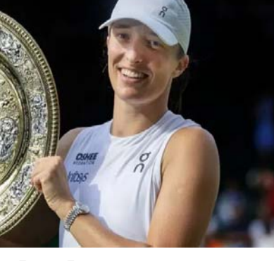
సియాటిక్ సింగిల్స్ టైటిల్ గెలుచుకున్నది.

క్వాలిఫయింగ్ రౌండ్తో పాటు అన్ని రౌండ్ల గురించి ఆలోచించామన్నారు. గ్రాండ్ స్లామ్ నిర్వహణ ద్వారా వస్తున్న ఆదాయంలో 16 శాతం అటాగ్లకు ఇవ్వాలన్న డిమాండ్ ఉండవచ్చు. ఇటీవల ముగిసిన ఫ్రెంచ్ ఓపెన్లో ప్రైజ్ మనీ 9.5 శాతం పెంచారు. కానీ ఆ పెంపు పట్ల చాలా మంది అటాగ్ల నిరాశను వ్యక్తం చేశారు. కొందరు అటాగ్ల నిరసన కూడా చేపట్టారు. అయితే గత ఏడాది యూఎస్ ఒపెన్ కోసం 20 శాతం ప్రైజ్ మనీ పెంచారు. ఇక ఈ ఏడాది అమౌంట్ను త్వరలో ప్రకటించనున్నారు. గత ఏడాది వింబుల్డన్లో జానిక్ సిస్టర్ మెన్స్ చాంపియన్ గా నిలిచాడు. ఇక మహిళల విభాగంలో ఖా