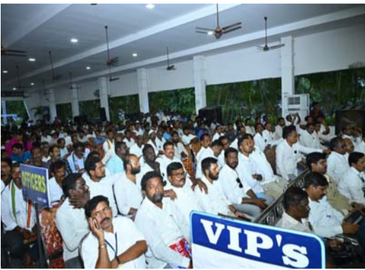
రెండు పార్టీలలో సింగరేణికి రూ. 9647 కోట్ల నష్టం.. సింగరేణి పరిరక్షణ కాంగ్రెస్ ప్రభుత్వ లక్ష్యం.. కేంద్రంలో బీజేపీ అధికారంలో ఉంటే ప్రజాస్వామ్యానికి ముప్పు..