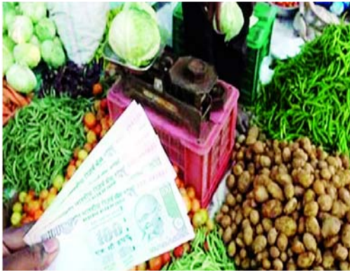
కేంద్ర ప్రభుత్వం తగిన దిద్దుబాటు చర్యలు తీసుకునేందుకు వీలుంటుంది. పీపీఐ అవుట్పుట్ ప్రైస్ రూపాన్ని, వస్త్రాలు, వర్కల మార్కెట్ల కలసి రిటైల్ ధరలు నిర్ణయమవుతాయి

ధరల తీరును మరింత ప్రతిఫలించే విధంగా వస్తు, సేవలకు ఉత్పత్తిదారుల ధరల సూచీ (పీపీఐ)ని కేంద్ర ప్రభుత్వం కొత్తగా ప్రకటించింది. ప్రస్తుతం ప్రతి నెలా విడుదల చేస్తున్న టోకు ధరల ఆధారిత సూచీ స్థానంలో వచ్చే బదలెట్లకు దీన్ని పూర్తిస్థాయిలో ప్రవేశపెట్టనుంది. దేశవ్యాప్తంగా మే నెలకు అన్ని కమాడిటీలకు సంబంధించి అవుట్పుట్ పీపీఐ 109.6 శాతంగా నమోదైంది. ఏప్రిల్లో ఇది 108.6 శాతంగా ఉంది. తయారీ రంగానికి సంబంధించి ప్రయోగాత్మక ఇన్పుట్ పీపీఐ మే నెలకు 104.9గా ఉంది. ప్రయోగాత్మక విధానంలో విడుదల చేస్తున్న ఈ డేటా నాణ్యతను పరిశీలించి, భాగస్వాముల అభిప్రాయాలను తెలుసుకుని అవసరమైన దిద్దుబాటు చర్యలు తీసుకుంటామని ప్రభుత్వం తెలిపింది. అభివృద్ధి చెందిన దేశాల్లో ప్రస్తుతం ఇదే విధానం అమల్లో ఉంది. దీంతో భారత్ సైతం డబ్ల్యూసీఐ నుంచి పీపీఐకి మారాలంటూ ప్రపంచ ప్రవృత్తి సంస్థ (ఐఎంఎఫ్) చాన్సెల్లర్లు కోరుతోంది. దీనికోసం నీతిఆయోగ్ వర్సింగ్ గ్రూప్ ఇటీవలే చేసిన సిఫారసుల మేరకు పీపీఐకి మారాలని కేంద్ర ప్రభుత్వం నిర్ణయించింది. ఒక ఉత్పత్తి తయారీ లేదా సేవను అందించేందుకు కంపెనీకి అయ్యే వ్యయాన్ని ఇన్పుట్ ప్రైస్ రూపంలో, తయారీ అనంతరం ఆయా సంస్థలు విక్రయించే ధరను